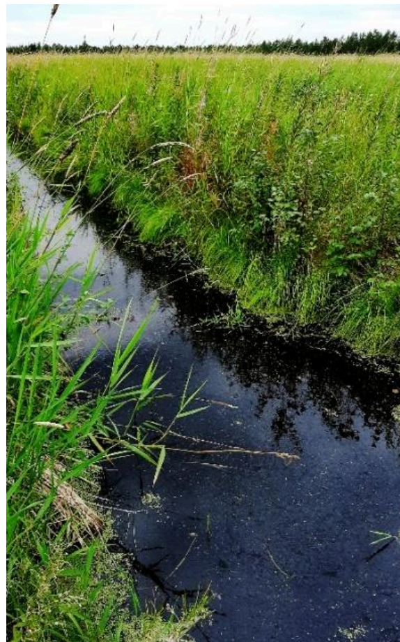
Obrázok 1. Trávnaté pole v paludikultúre. Pestovaná tráva sa môže použiť ako podstielka pre zvieratá, krmivo alebo pestovateľské médiá v záhradníctve.

Rašelina sa hromadí, keď voda spomaľuje rozklad rastlinných zvyškov. Odvodnenie tento zvráti tento proces a spôsobí vysoké emisie skleníkových plynov z rozkladu rašeliny. Globálne otepľovanie emisie ďalej zvyšuje. Alternatívami k poľnohospodárstvu na odvodnených paludikultúry. Obe možnosti môžu znížiť emisie skleníkových plynov, ale ani jedna z nich úplne neobnoví degradované rašeliniská. Obnova vedie k vyššej prírodnej hodnote, zatiaľ čo paludikultúra umožňuje pokračujúcu produkciu biomasy a odstraňovanie živín, čo potenciálne uľahčuje následnú obnovu prirodzenej vegetácie prispôbenej nízkemu stavu živín.