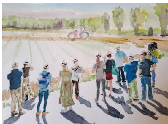
Akvarel od Rocía Lansaac s názvom „Vedci a podnikatelia na poľnej stanici La Canaleja, CSIC Madrid“.

Národné strediská v rámci projektu EJP Pôda sú nástrojom vyvinutým na konzultácie s podnikateľmi a vytváranie prepojení vedy a politiky s poľnohospodárskou praxou. Členovia národných stredísk predstavujú ducha národných poľnohospodárskych systémov a spôsobov obhospodarovania pôdy a sú pozývaní na príslušné pravidelné porady, širšie zamerané podujatiach a pracovné stretnutia. Členovia vyjadrujú regionálne a národné potreby, prispievajú k formovaniu stanovísk svojich krajín k spôsobom obhospodarovania poľnohospodárskej pôdy, zdieľajú a vymieňajú si znalosti, a tým prispievajú k výstupom programu EJP SOIL a učia sa z nich.